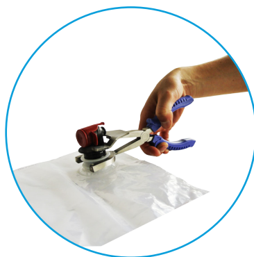
Introducir la base de la pinza en la parte superior del cuello