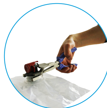
Apretar hasta que el grifo Vitop® este insertado totalmente y hasta el final dentro del cuello